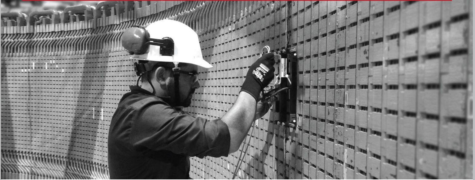
Prueba ELCID en Generador 94000 kVA/ 120 RPM